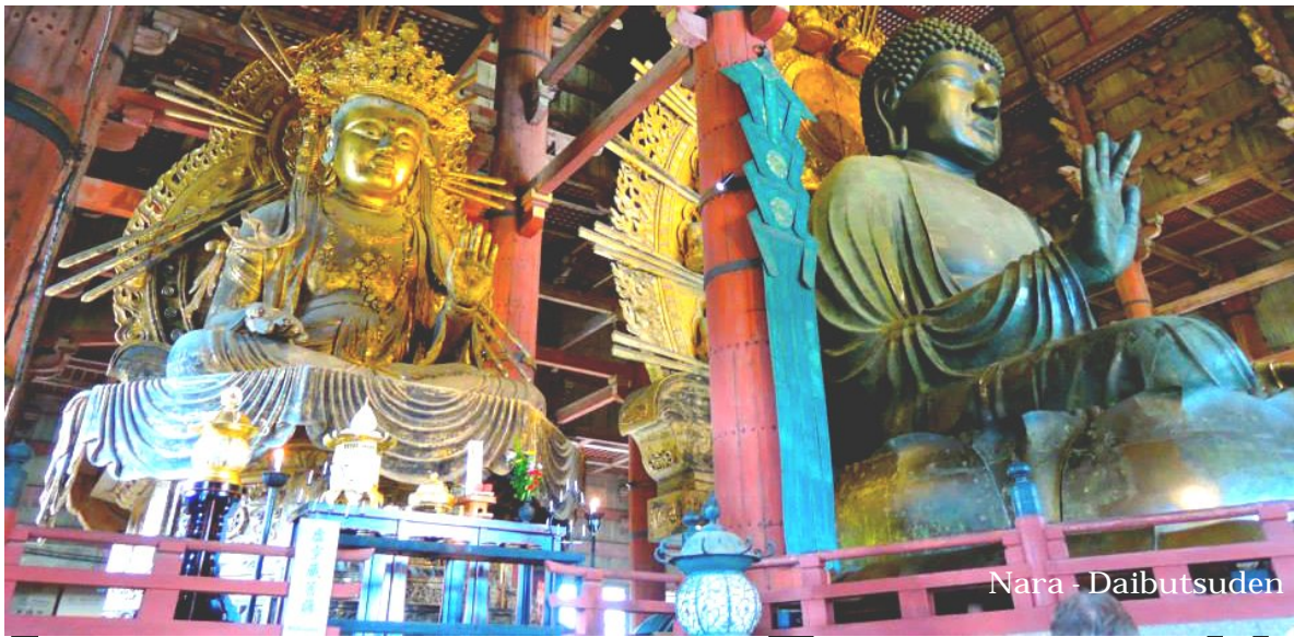
Nara - Daibutsuden