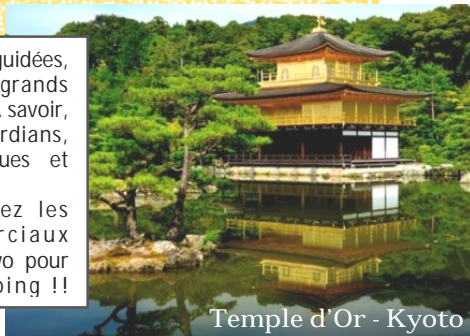
Temple d'Or - Kyoto

Aussi, vous visiterez les quartiers commerciaux comme Ginza au Tokyo pour profiter du Shopping !!